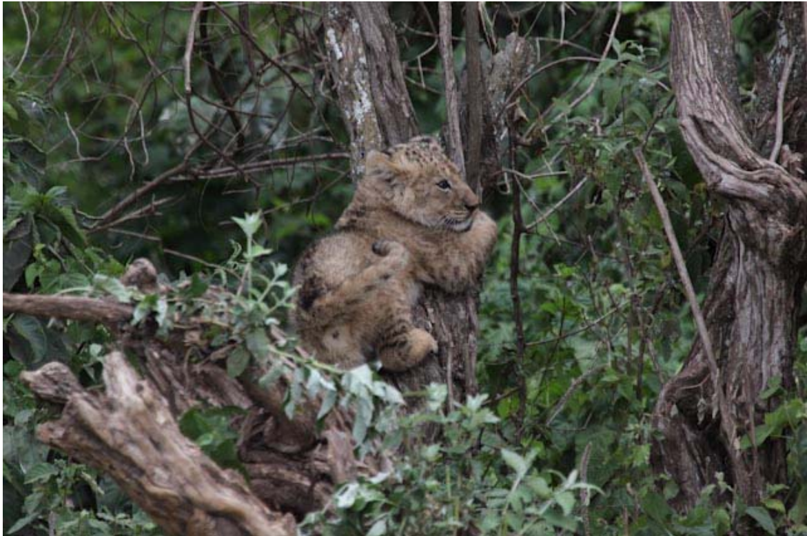
Den Kleinen haben Sie vergessen