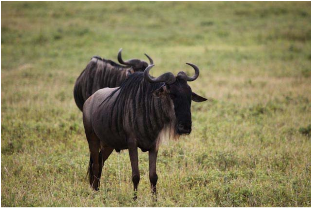
Zur Beruhigung ein paar Gnus