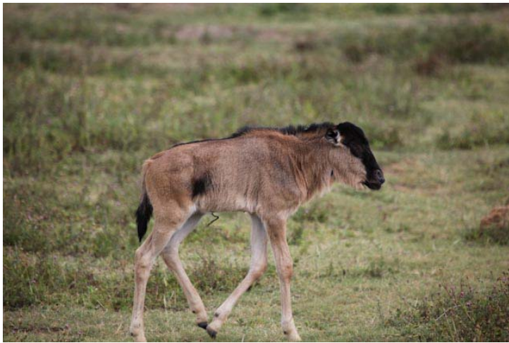
Kleines Gnu, Hyänen-Nahrung!!!