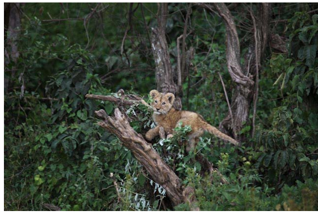
Besser gesagt die Kleinen waren nämlich zwei kleine Katzen