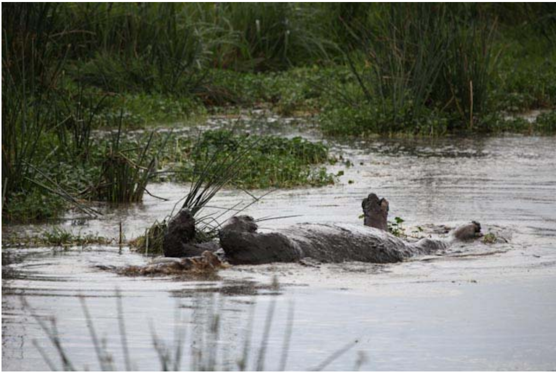
Scheinen sich sau wohl zu fühlen, die Hippos