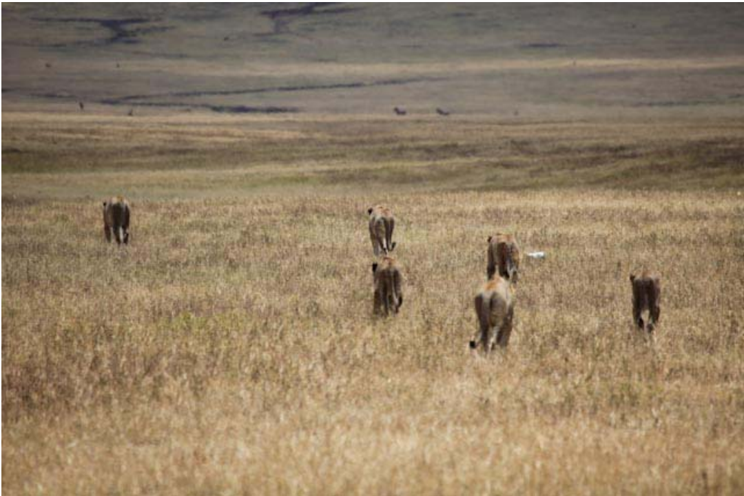
Ob sie die Ruhe suchen oder hungrig sind wird sich zeigen.