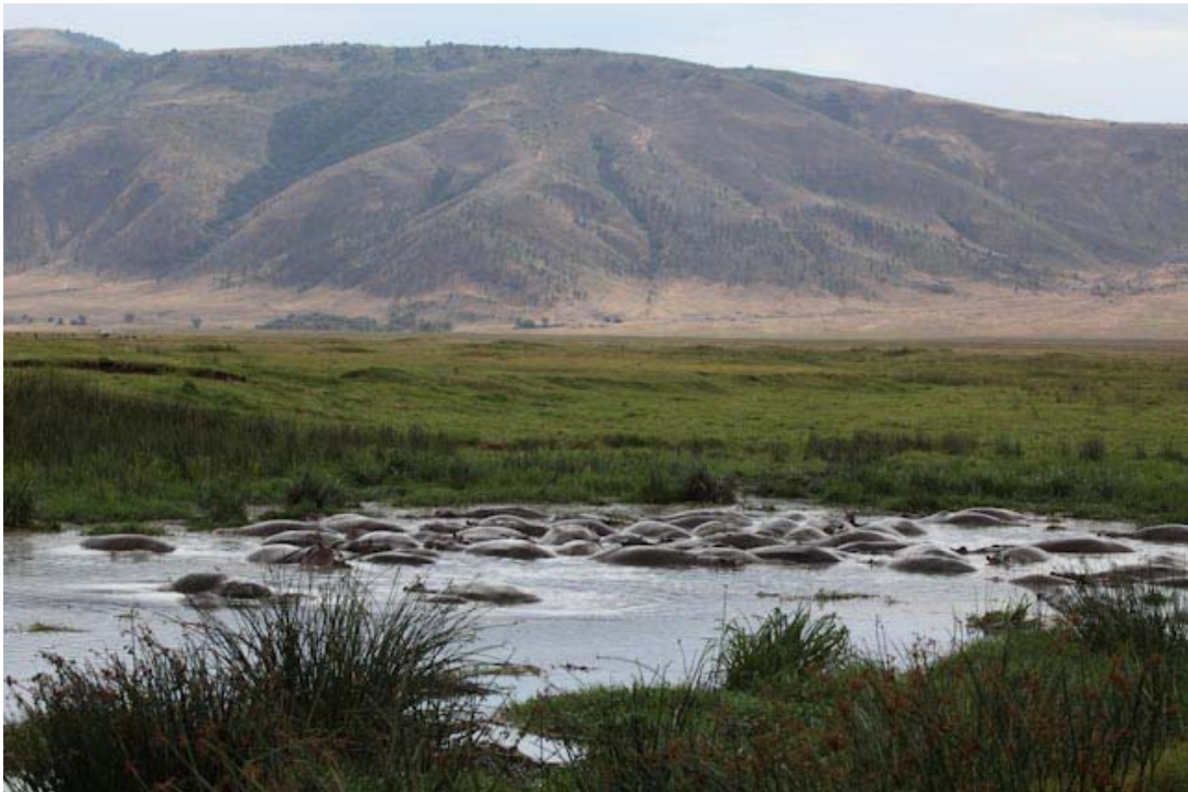
...oder soll ich sagen das ist ein Hippo Spa!!!