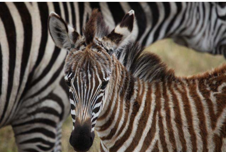
Die Baby Zebras sind braun, später wenn sie ganz reif sind werden sie dann auch schwarz-weiß.