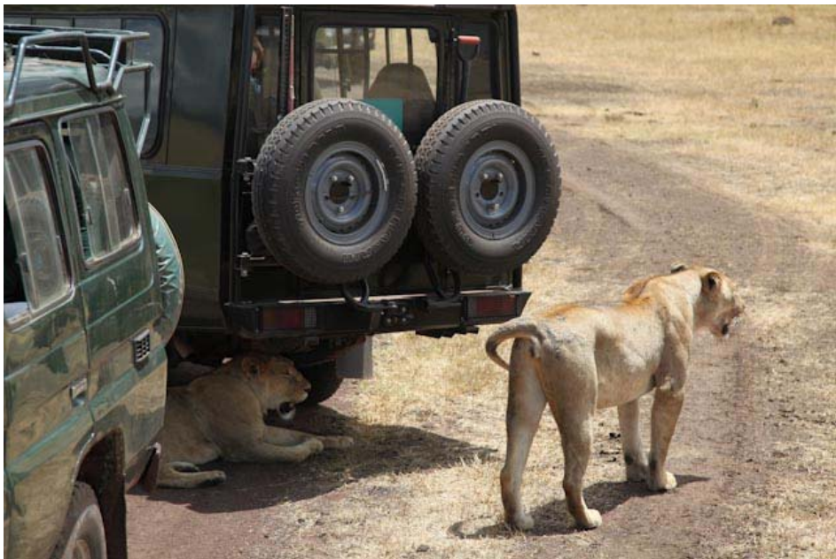
Oder ist es nur wegen des Schattens